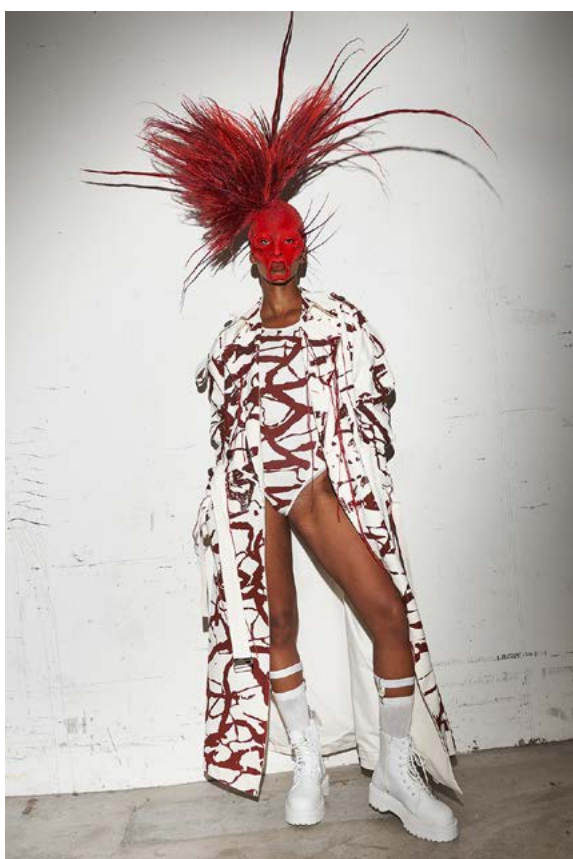
Creatures of the Unknown / collection de 10 masques pour maison.blanche.swiss 2024 / sculpture portable / silicone, pigments, cheveux et poils synthétiques / dimensions variables mode suisse '24 - Kunsthalle Zürich