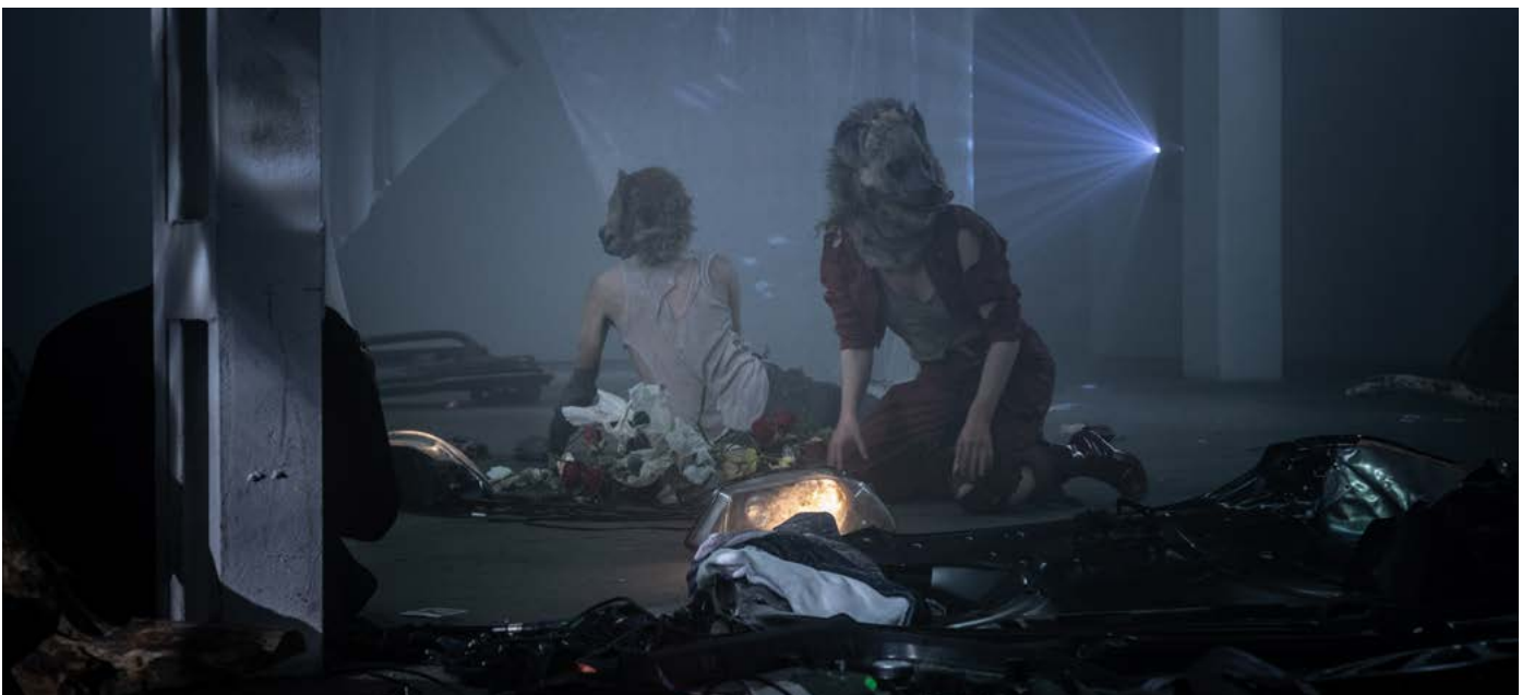
présentation à la Fonderie Kugler, Genève