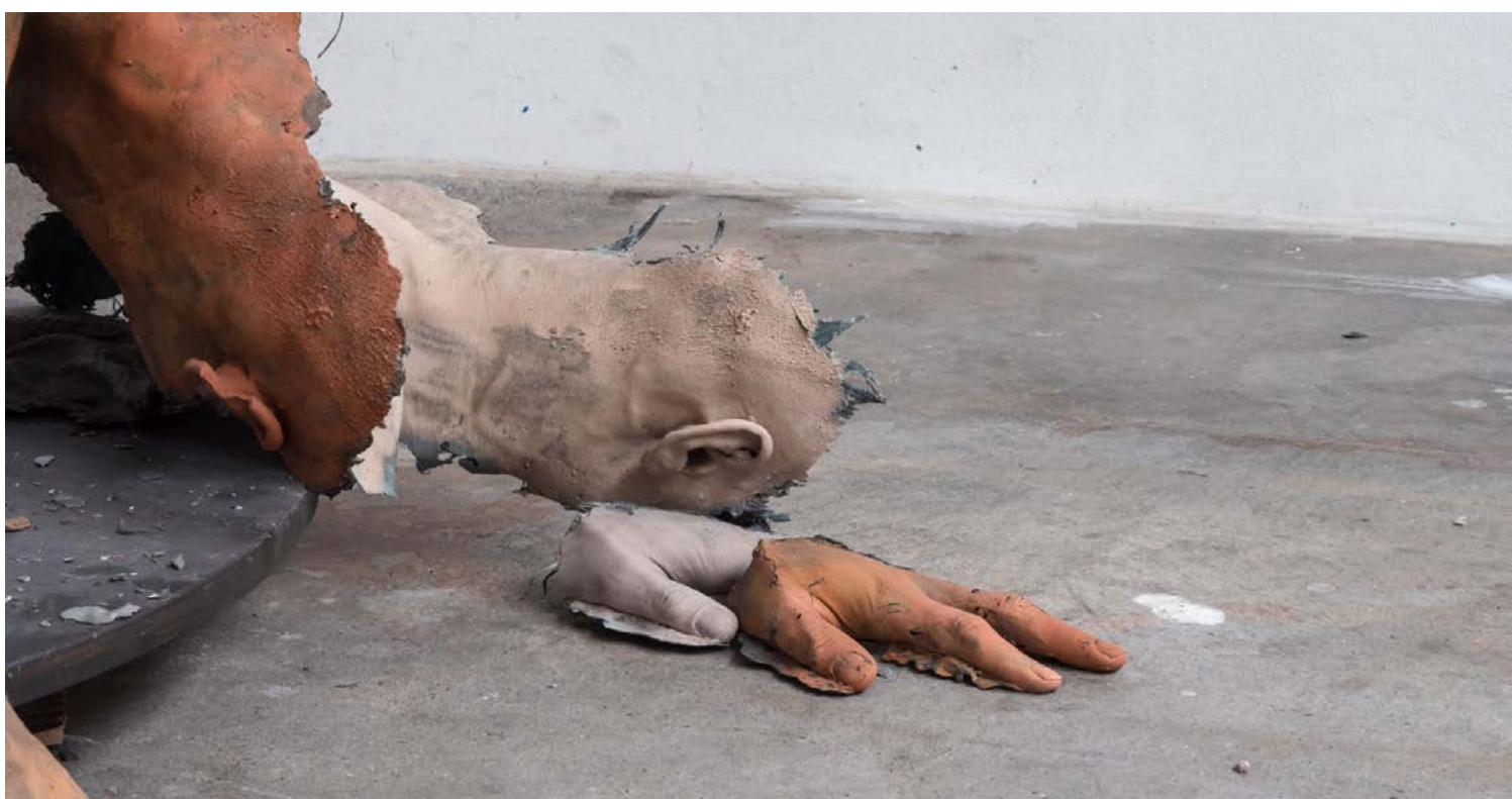
Body Rising (details)