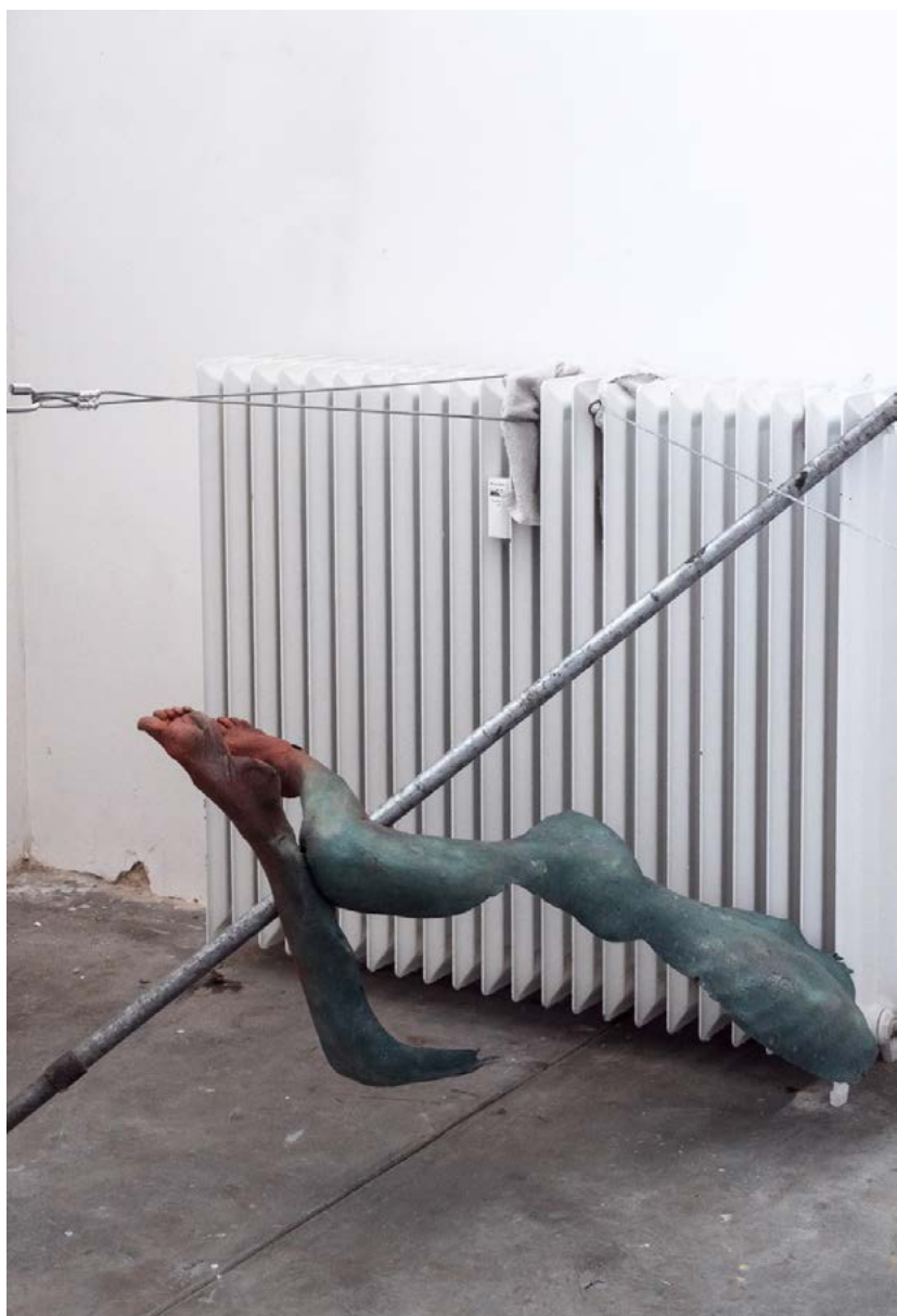
Figures On Sticks (details)