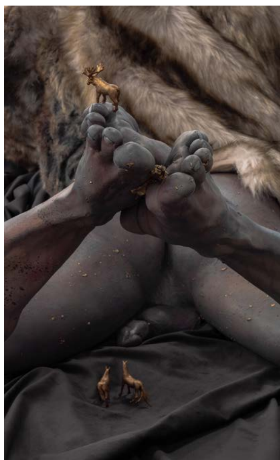
L'Agonie de l'Eros (details)