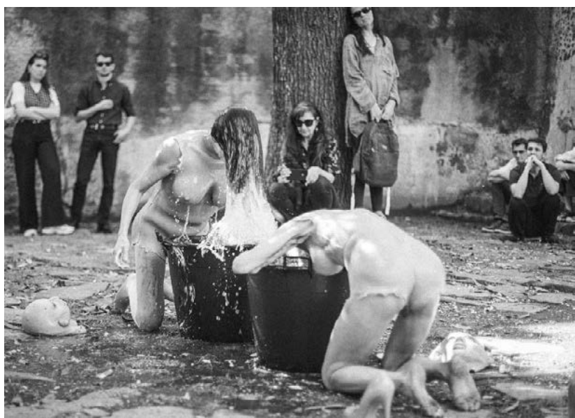
présentation à Bally Foundation, Lugano