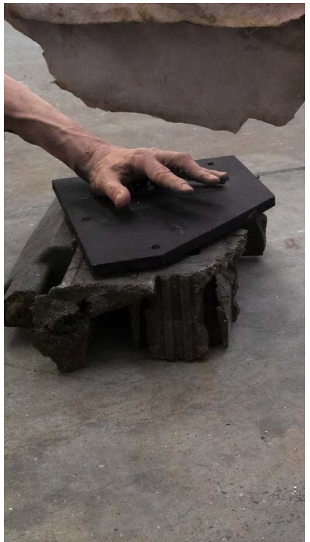
The More You Pull (details)